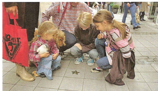
Guck mal - ein Stern, der deinen Namen trägt! Mitten in Münster leuchten Herzenssterne.

Herzenssterne locken Neuspender an. Die Zahl derjenigen, die sich zum ersten Mal in ihrem Leben im Zentrum für Transfusionsmedizin an der Sperlichstraße an die Nadel legten, stieg von 396 (2008) auf 791 (2009). Die Aktion läuft noch bis zum 31. Dezember 2010. Spendet jemand im Aktionszeitraum vier weitere Male Blut, wird sein Stern durch einen größeren ersetzt. Wer jetzt die Erstspende wagt, hat ab sofort die Möglichkeit, schon während der Spende den Platz für seinen Stern auszusuchen: Die neue City-Blutspende-Station liegt unmittelbar am Herzenssterne-Boulevard!